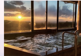
■香りの湯からの夕日