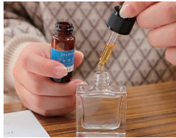
体験・ポタニカル香水作り