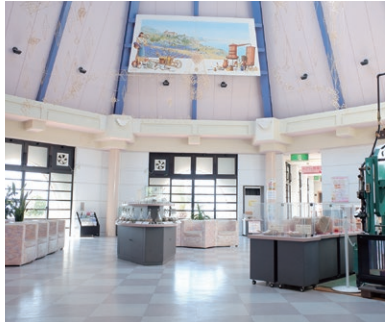
■エントランスホール

ボプリの部屋では、自分だけの香りが作れるポタニカル香水作りなど、6種類の体験ができます。エントランスホールでは、ドライハーブや香水、地場産業のお香など、香りに関する展示をお楽しみいただけます。