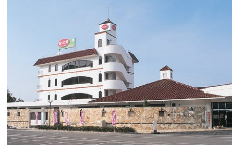
■香りの宿 香りの湯に隣接した、眺望が良い宿泊施設。

ハーブの香りがほのかに漂う客室は、美しい夕日と播磨灘を見下ろす至高の眺めが魅力。静かな淡路島で癒しのひとときをお過ごしください。