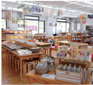
■ボプリの部屋 (香りの手作り体験)